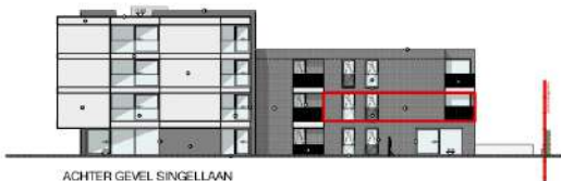
ACHTER GEVEL SINGELLAAN