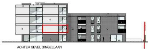
ACHTER GEVEL SINGELLAAN