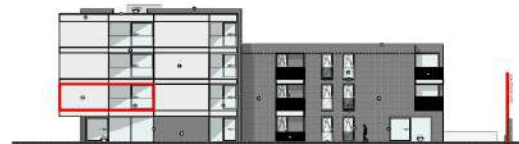
ACHTER GEVEL SINGELLAAN

De plannen zijn verkoopplannen, geen uitvoeringsplannen. Afmetingen van schachten en dgl. kunnen om technische redenen wijzigen. Plannen zijn indicatief en niet contractueel bindend.