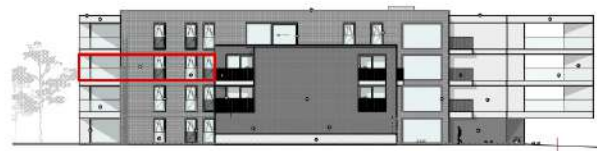
ACHTER GEVEL STAATSBAAAN

De plannen zijn verkoopplannen, geen uitvoeringsplannen. Afmetingen van schachten en dgl. kunnen om technische redenen wijzigen. Plannen zijn indicatief en niet contractueel bindend.