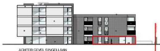
ACHTER GEVEL SINGELLAAN