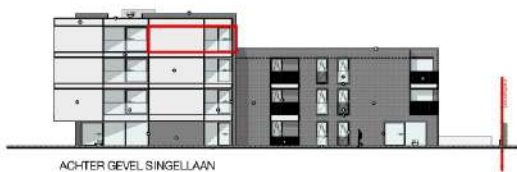
ACHTER GEVEL SINGELLAAN