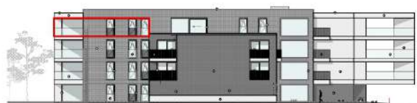
ACHTER GEVEL STAATSBAAAN

De plannen zijn verkoopplannen, geen uitvoeringsplannen. Afmetingen van schachten en dgl. kunnen om technische redenen wijzigen. Plannen zijn indicatief en niet contractueel bindend.